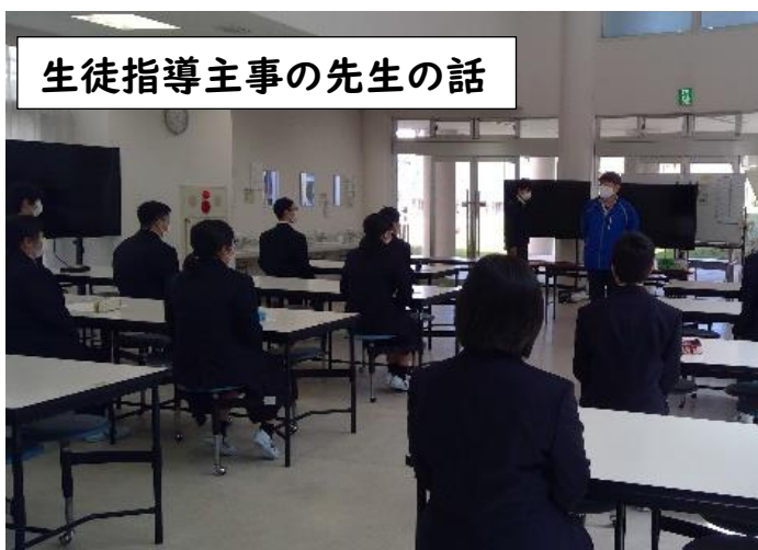
生徒指導主事の先生の話