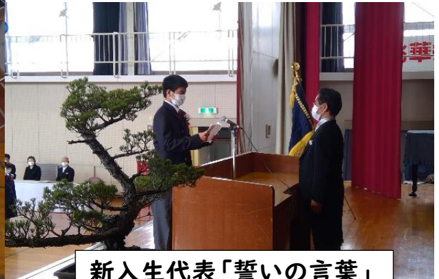
新入生代表「誓いの言葉」