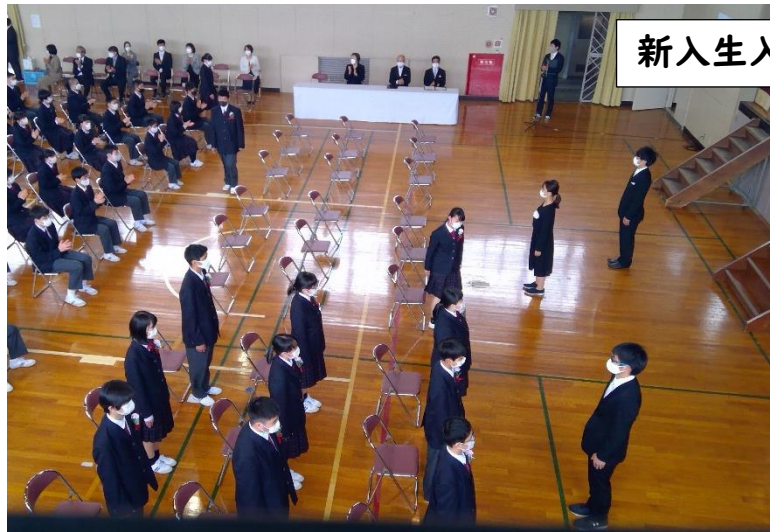
新入生入場!ドキドキ、緊張