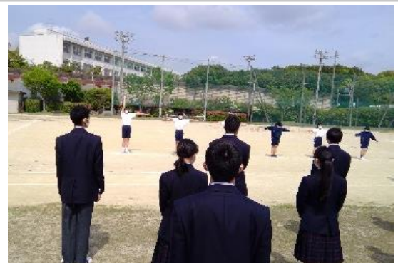
一糸乱れぬ動きに感動! かっこいい!!